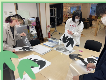
↓ 恐竜の足跡を製作する様子 ↓

迷子防止対策として、要所に設置した看板や恐竜の足跡は参加者の皆さんに楽しんでいただくため、学生たちが知恵を出し合いながら工夫して準備を進めたものです。また、参加者に配布する構内MAPには、恐竜の説明を加え、家に帰った後もお楽しみいただけるよう工夫しました。その他、QRコードの読み込み確認やエラー時の対応などについても学生同士で準備を進めました。